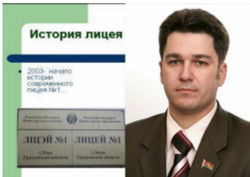
1 сентября 2003 г. состоялось торжественное открытие первого в городе лицея, директором